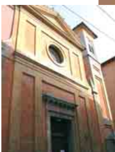
Sopra: la chiesa Labarum coeli. Di fianco: Un momento della celebrazione della Pasqua a Bologna della comunità cristiana ortodossa di Eritrea